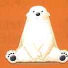
イメージキャラクターのくま

当社では、感染の予防対策として、手洗い・うがい・マスク着用・咳エチケットなど、お客様並びにスタッフの健康と安全確保を考慮し、施設内の手の触れる場所への除菌活動などをしっかりと行っており、個別での接客や十分なスペースを確保した上での対応を行っております。又、ご来店頂く際にはマスク着用をお願いしております。何卒ご了承くださいませ。